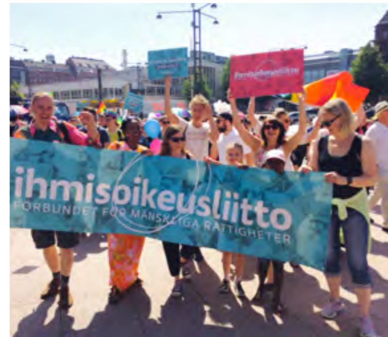
Kesällä 2016 osallistuimme ensimmäistä kertaa Pride-kulkueeseen.

TÄRKEÄT IHMISOIKEUSPROSESSIT pysyivät kiinteästi mukana vaikuttamistyössämme. Toimimme vahvasti näkemyksemme toiseen kansalliseen perus- ja ihmisoikeustoimintaohjelmaan sekä YK:n ihmisoikeusneuvostolle Suomen ihmisoikeustilanteen määräaikaistarkasteluun (Universal Periodic Review).