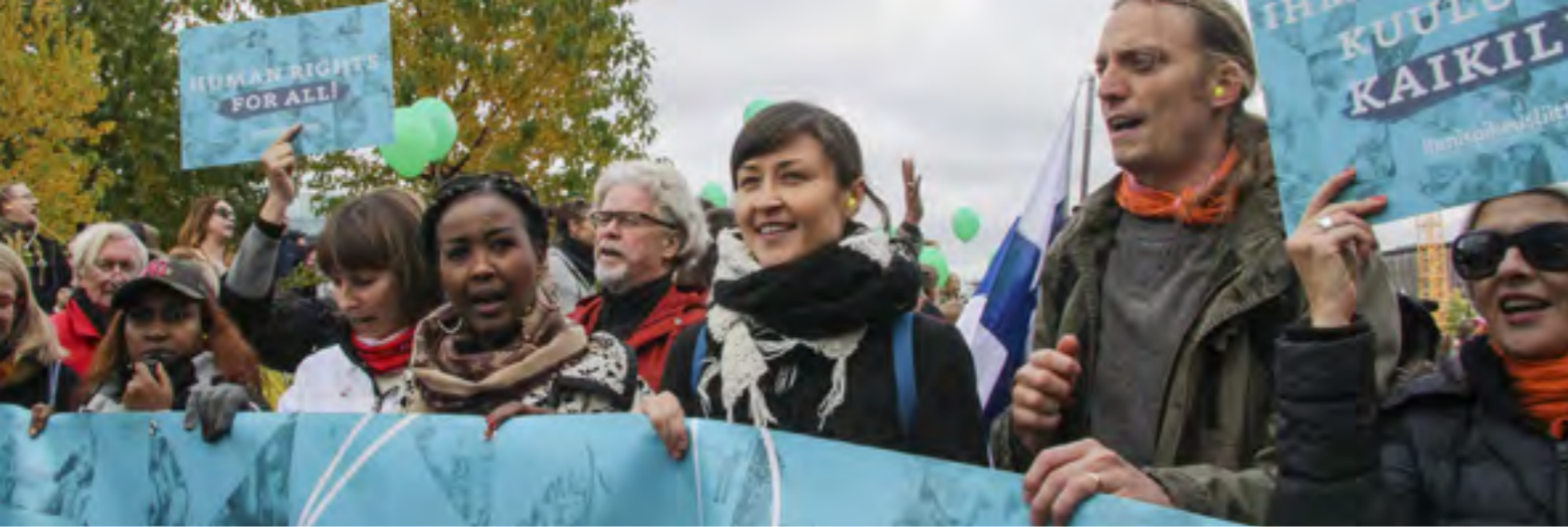
Ihmisoikeusliitto oli mukana järjestämässä Peli poikki -mielenosoitusta syyskuussa 2016. Osallistuimme myös marssille, kuten 15 000 muutakin ihmistä Helsingissä!