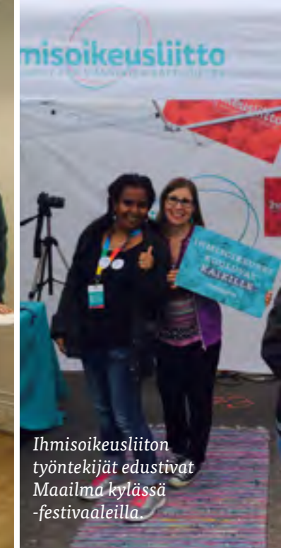
Ihmisoikeusliiton työntekijät edustivat Maailma kylässä -festivaaleilla.