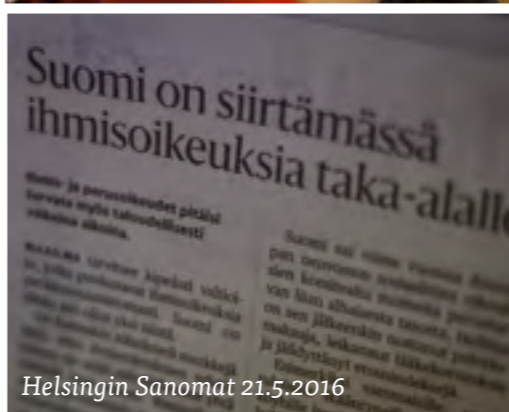
Helsingin Sanomat 21.5.2016